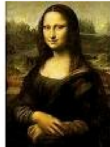
la Gioconda, Leonardo da