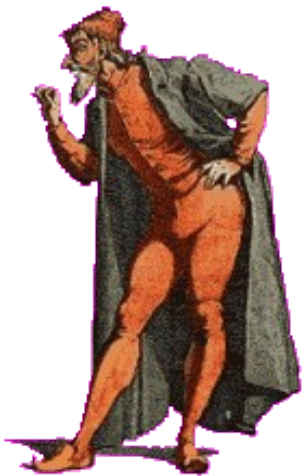
La Commedia dell'Arte

car l'Italie - par son histoire, son patrimoine, ( 40% du Patrimoine mondial selon l'UNESCO) son art, son peuple -, est l'un des berceaux de la civilisation moderne et fait partie de notre héritage culturel.